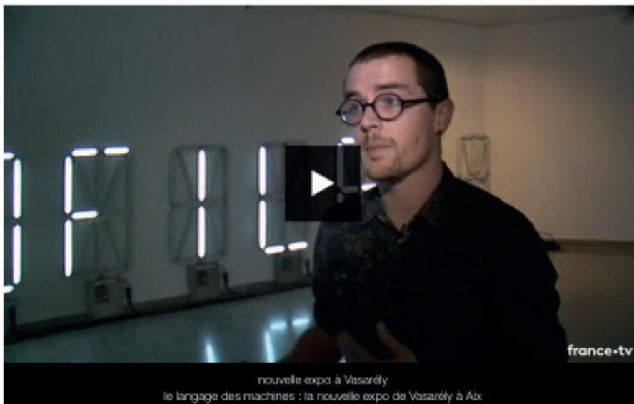
nouvelle expo à Vasarely le langage des machines : la nouvelle expo de Vasarely à Aix

"Langages des Machines" est visible à la fondation Vasarely jusqu'au 22 octobre. Une exposition qui nous questionne à l'ère de l'hypercommunication rendue possible par les technologies