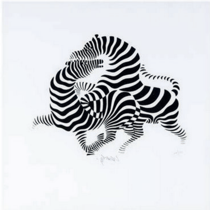
'Zebralar' serisinde yer alan bu çalışma sergi kapsamında görülebilir.