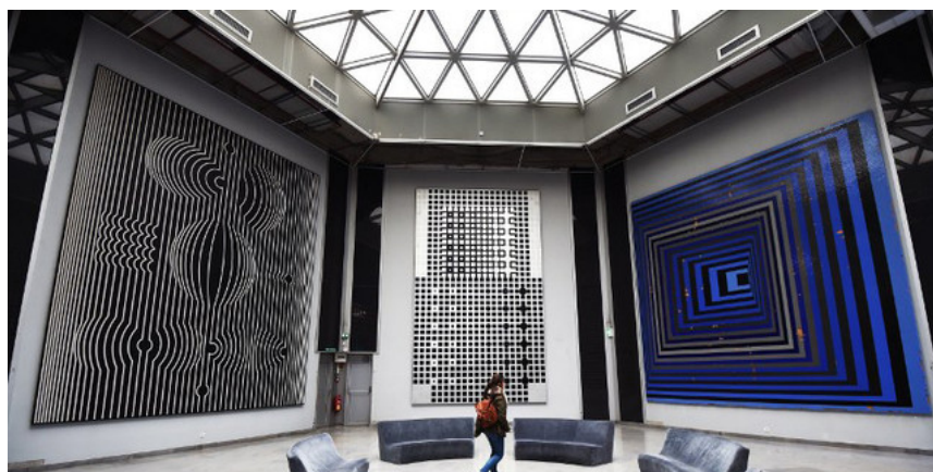
Oeuvres de Victor Vasarely exposées en 2016 à la Fondation Vasarely d'Aix-en-Provence (Vaucluse)

Mis à jour le 07/07/2016 à 10H10, publié le 07/07/2016 à 10H08